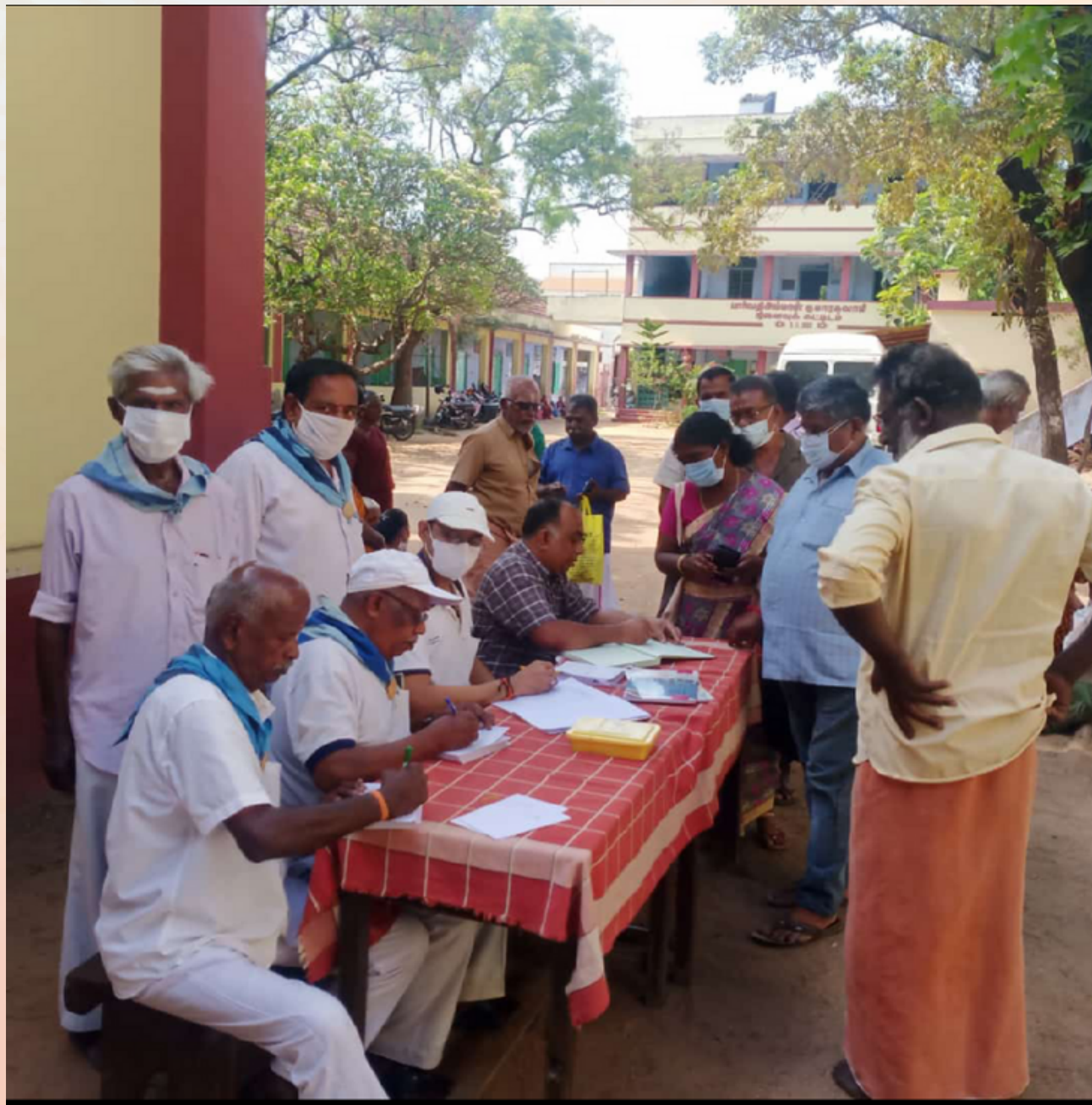
Free Eye Camp SSSSO Kanyakumari district

கன்னியாகுமரி மாவட்டத்தில், இலவச கண் சிகிச்சை முகாம் 02/04/2023 அன்று நடத்தப்பட்டது. சுமார் 189 வெளி நோயாளிகள் பயனைடைந்தனர். இதில் 82 பேர் ஆண் மற்றும் 107 மகிளாக்கள் பயனைடைந்தனர். 14 மருத்துவமனை ஊழியர்கள், ஒரு டிரைவர், ஒரு ஒருங்கிணைப்பாளர், இரண்டு மருத்துவர்கள், மற்றும் 24 ஆண் தொண்டர்கள் மற்றும் 4 மகிளாக்கள் இந்த சேவையில் கலந்து கொண்டனர்.